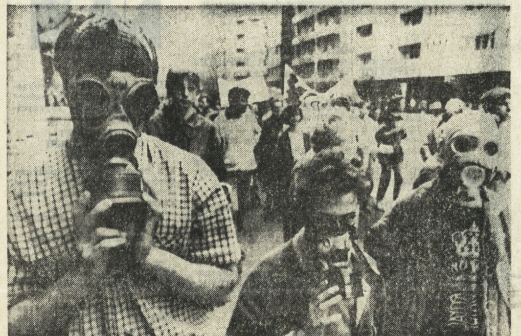
Будущее. Серьезную озабоченность вызывает состояние воздуха в столице. Выразили участники демонстрации, прошедшей по наиболее загрязненным улицам венгерской столицы.