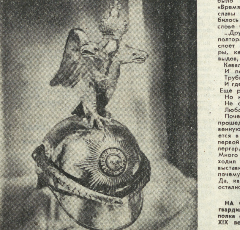
НА СНИМКАХ: каска лейб-гвардии конного кирасирского полка с Андреевской звездой, XIX век; в зале экспозиции.