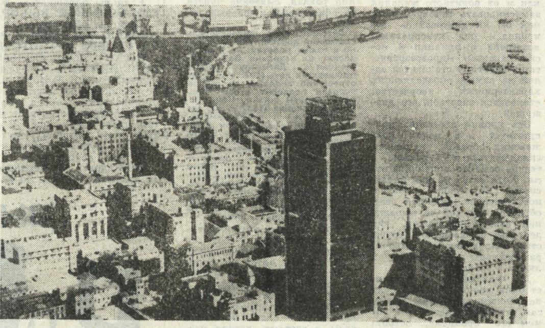
На снимке: вид на Шанхай с птичьего полета. Это крупнейший центр промышленности, торговли и науки Китая.