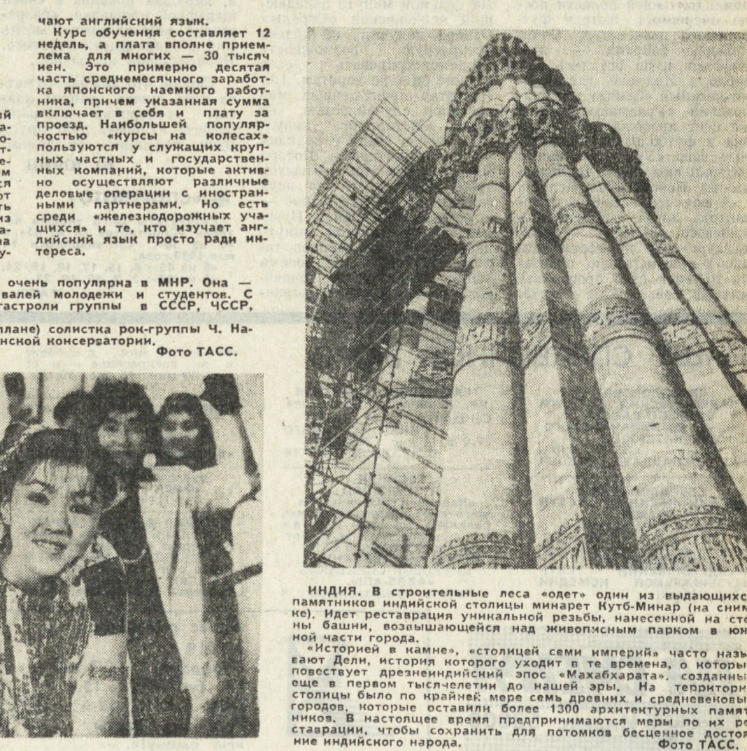
Индия: в строительные леса «летят» огни из выходящих памятников индийской столицы минарет Кутб-Минар (на снимке).