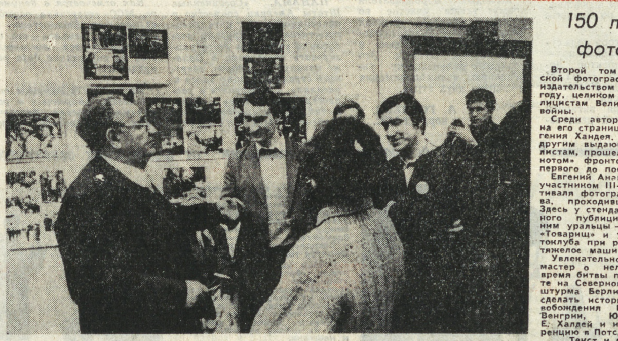
Второй том «Антологии советской фотографии», выпущенный издательством «Планета» в 1987 году...