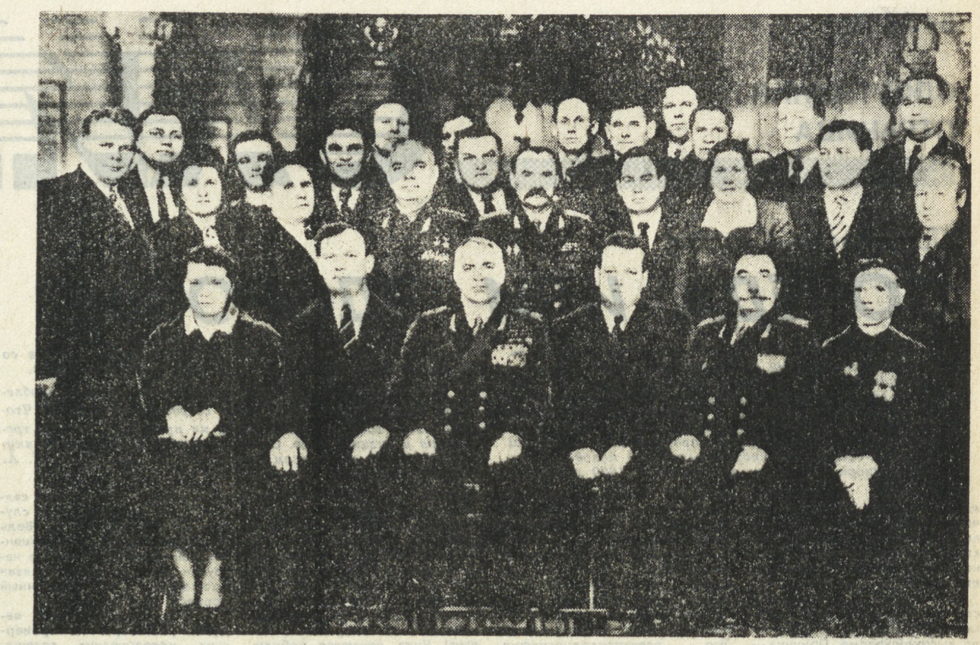
НА СНИМКЕ: делегаты Свердловской области на XX съезде КПСС. Памятное фото.

Из опубликованных теперь документов видно, что еще