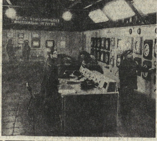
М. М. ОБУХ-ШВЕЦ, руководитель агрегата доменной печи № 2, комсомольско-молодежный коллектив