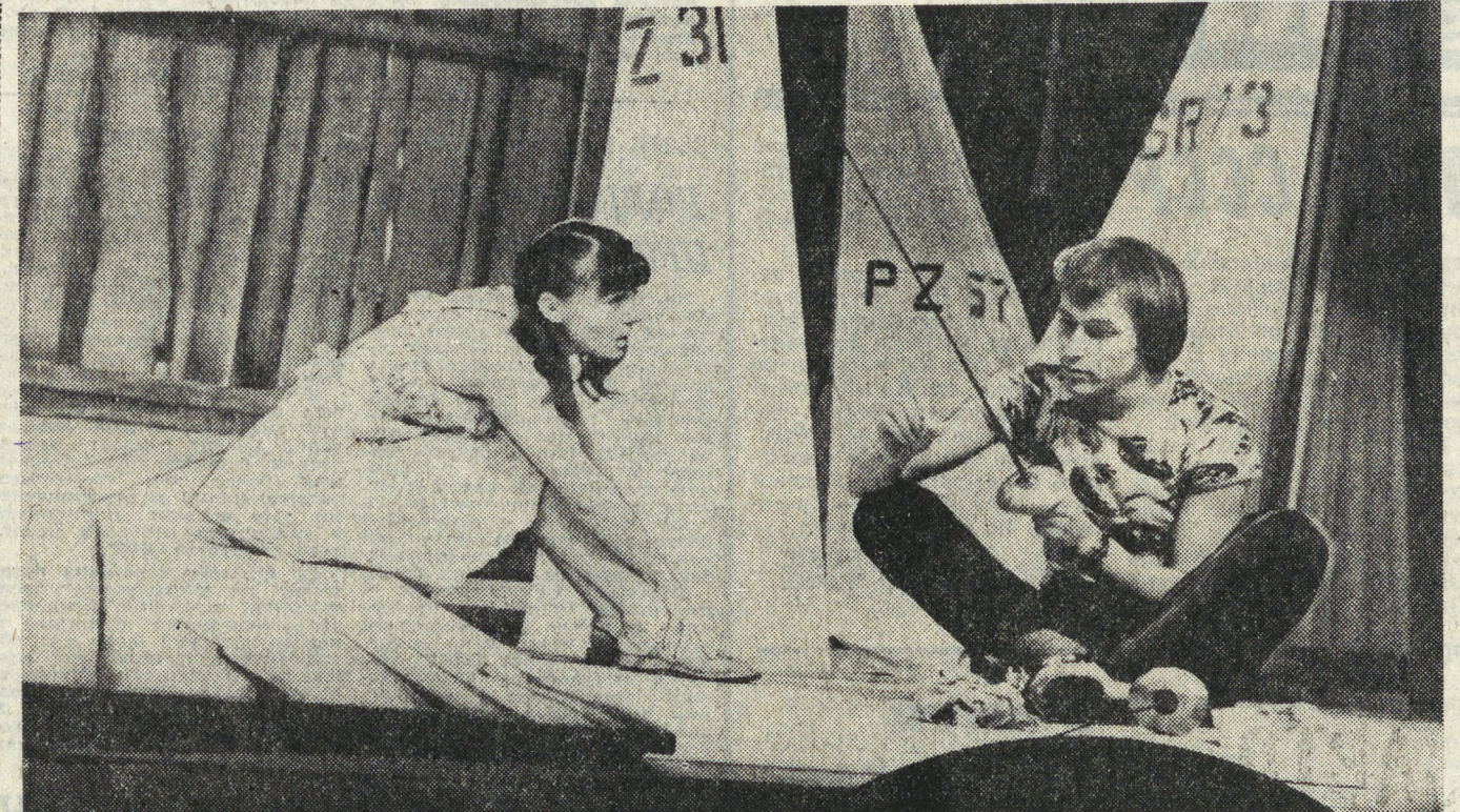
ВСЕСОЮЗНАЯ НЕДЕЛЯ «ТЕАТР — ДЕТЯМ И ЮНОШЕСТВУ»

Стручковый перец содержит большое количество аскорбиновой кислоты и богат такими витаминами, как В, В2 и С, а также железом, калием, углеродом, протеем и аминокислотами. И все же специалисты призывают не злоупотреблять перцем, так как чрезмерное увлечение им вредно и