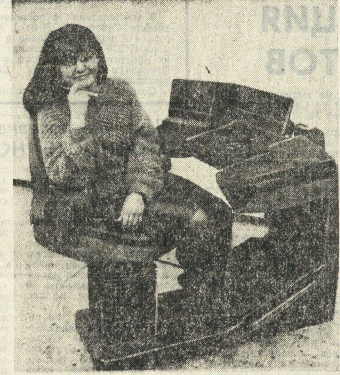
Метро рождается на «ВАЗе».

«Верно ли, что в Полеском есть кооператив, который произвел в прошлом году продукции почти на два миллиона рублей. Не могли бы вы рассказать о нем?»