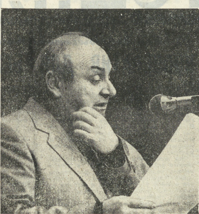
Михаил Михайлович, если бы вы были молоды сейчас, сегодня, то в какую из неформальных общественных организаций могли бы вступить?