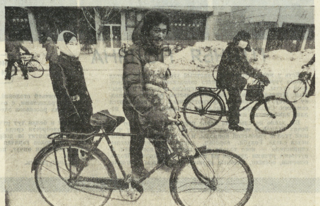
КНР. Из приграничного города Хэйхэ, в северо-восточном Китае, можно ясно видеть советский город Благовещенск, расположенный на другом берегу реки Хэйлуцзян (Амур).

Вради ли стоит говорить здесь о том, что наркомафия уедает подкупать и некоторых полицейских.