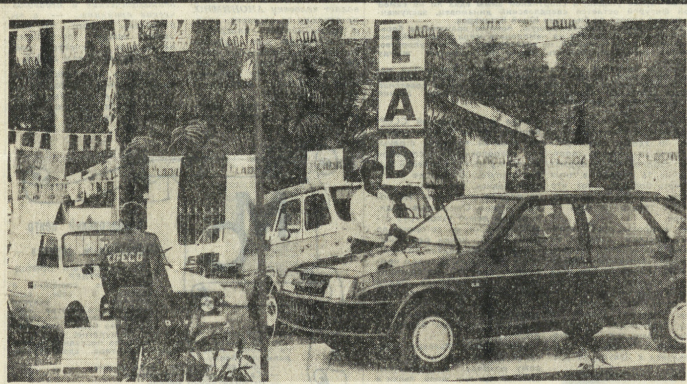
Надежность, экономичность и невысокая цена — «золото» советских автомобилей в условиях сегодняшней Африки.

Сегодня, как никогда, пожалуй, прежде, важно укреплять атмосферу доверия между людьми из разных стран, сплачивать наши ряды в борьбе за мир, против ядерной катастрофы.