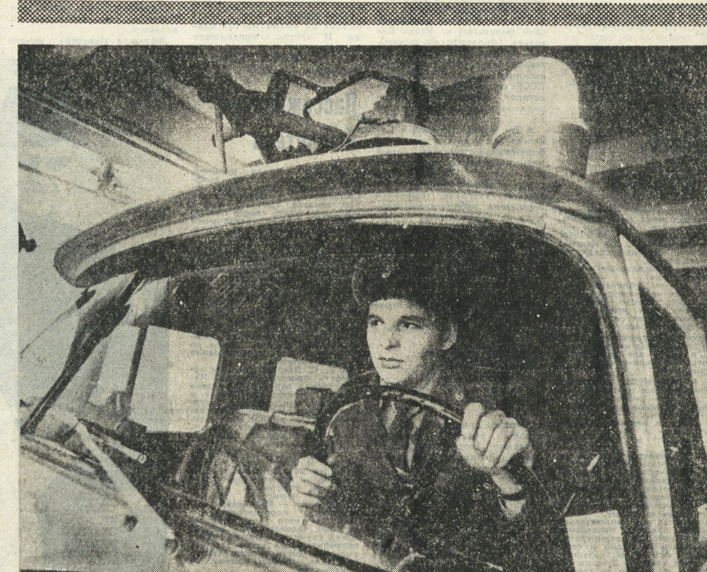
За рулем пожарных машин, как правило, сидят очень высокого класса. Понятно: ива с включенной сиреной на большой скорости на красный сигнал светофора, надо иметь недюжинную выдержку, прекрасную реакцию, изрядный опыт владения собой в непредвиденных ситуациях. Боевые расчеты пожарных всегда могут дать оценку качествам водителей своих машин. Тем более,

Владельцы видеоманифонов отреагировали на «решение» быстро. Знатоки тех, кто решил поблужать по дальним деревням. Входная плата там, как слышит, три рубля. Появляется снова «андерграунд» — те, кто собирает аудиотраны с себя «на кату». Тут уж грешков не ограничилось — пять рублей минимум. И крутят, увы, даже не «Грешную смознозилу», а филммы покурне. И очень отчетливо представляю, как на четвертом этаже какого-нибудь блочного дома, в тесной квартирке подростки с замарином сердца будут смотреть «Нану». А внизу, в полупустой видеотеке, участковый со списком в руках будет проверять соответствие реального репертуара разрешенному. Чем-то знакомым до боли поведало. Г. ГРИГОРЬЕВ, Первоуральск.