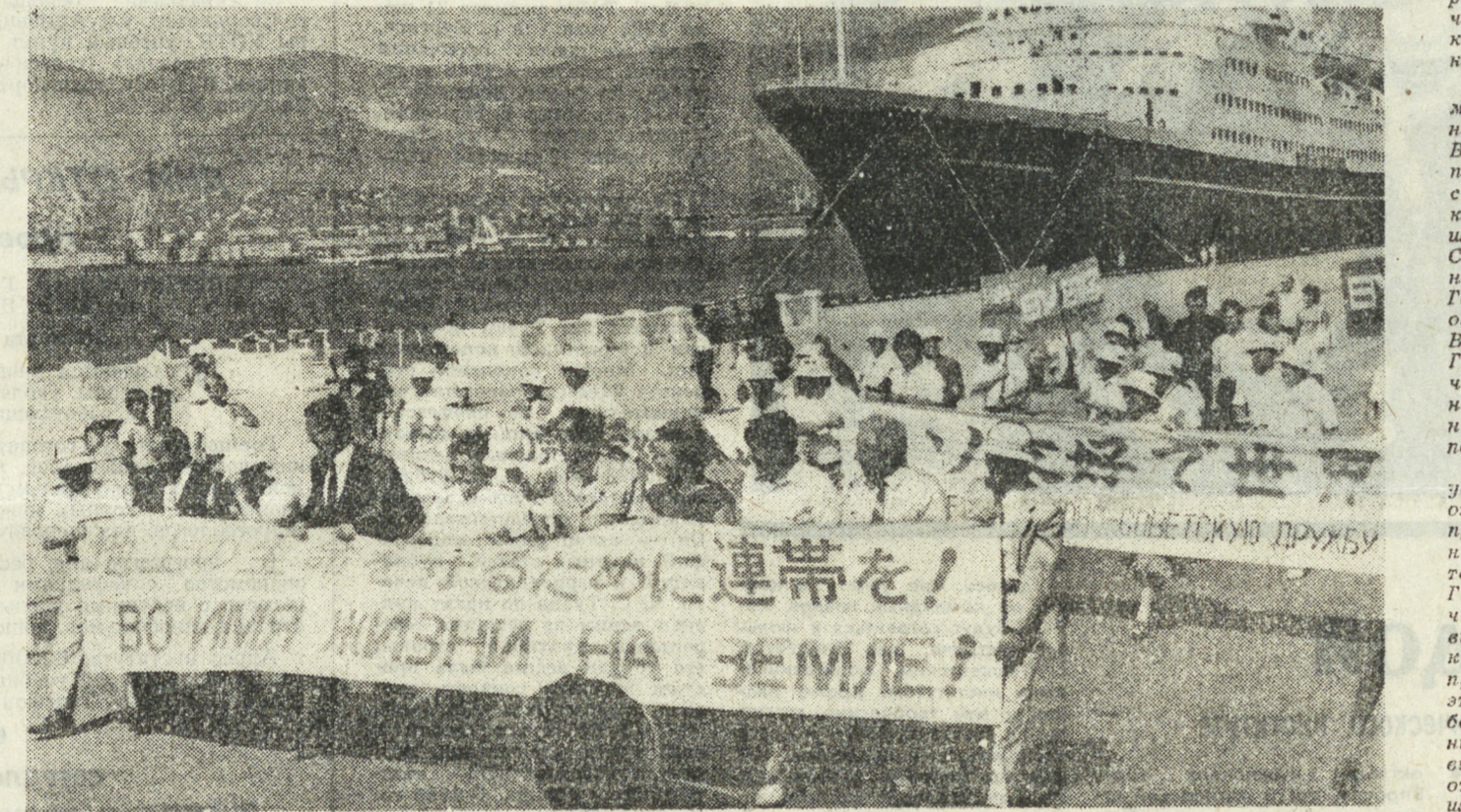
В Новороссийске состоялась манифестация и многотысячный митинг мира, в котором приняла участие делегация японской мироловливой общественности. Вместе с жителями советского города-героя представители профсоюзных, женских, молодежных, студенческих организаций Японии единодушно приняли «антиядерную платформу» — обращение к народам мира с призывом сделать все возможное, чтобы XXI век стал веком мира, свободным от ядерного оружия.