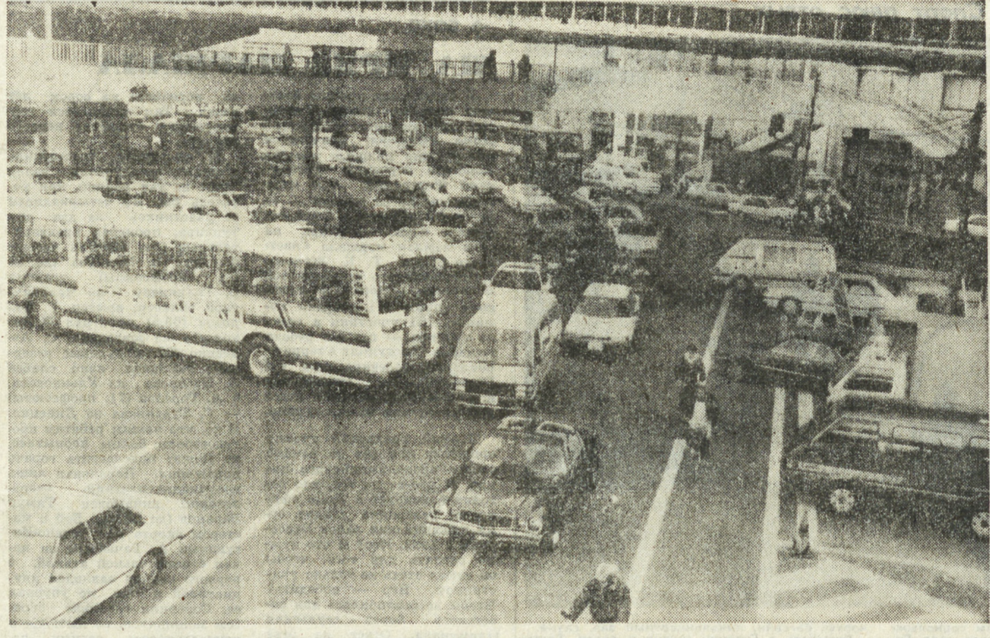
ПА СНИМКЕ: Токийская улица в час пик.