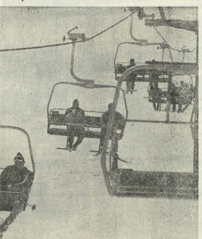
ГРУЗИНСКАЯ ССР. Современным горнолыжным центром становится небольшое село Гудари, расположенное в отрогах Главного Кавказского хребта на высоте 2000 метров над уровнем моря. В этом районе снег держится на склонах гор с октября по май. Четыре канатные дороги доставляют лыжников до места старта, а финиш — прямо у порога нового гостиничного комплекса. В комфортабельном отеле на 320 мест — крытые теннисные