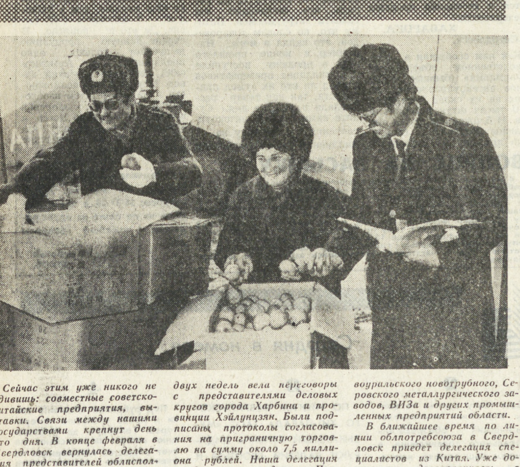
Сейчас этим уже никого не удивишь: совместные советско-китайские предприятия, амбары. Связи между нашими государствами крепнут...