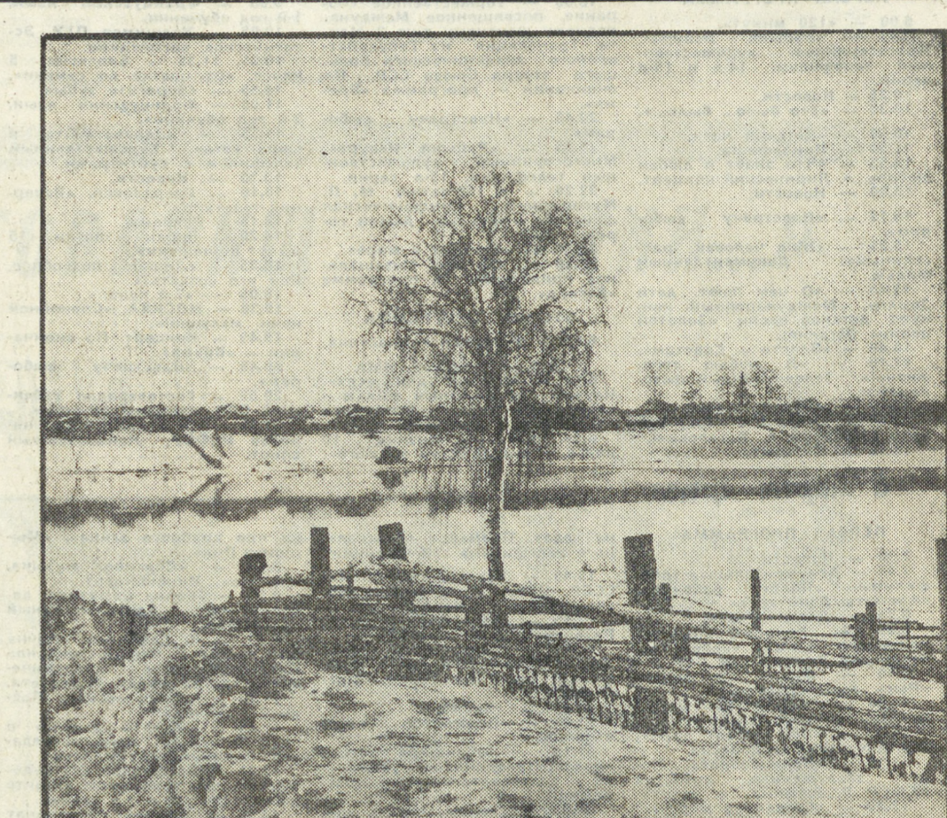
На пороге весны.

быть три-четыре таких же других, на вид даже лучше, с раннего утра до середины дня усердно оципывает мороженые ягоды.