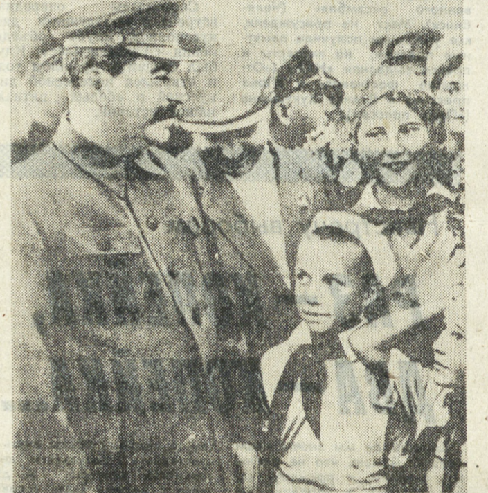
НА СНИМКАХ: участники конференции общества «Мемориал» у стенда «Черная книга преступлений сталинизма: Сталин среди детей на Тушинском аэродроме (1936 г.).