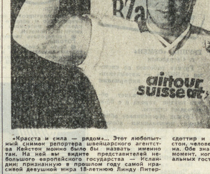
«Красота и сила — рядом... Этот любопытный снимок репортера швейцарского агентства Кейстон можно было бы назвать именно так. На ней вы видите представительницу небольшого европейского государства — испанку, признанную в прошлом году самой красивой девушкой мира 18-летнюю Линду Питер-

сондоттир и самого сильного, как считает Кейстон, человека на планете Юан-Пола Сигмарсона. Обе знаменитости сфотографированы в тот момент, когда они прибыли в качестве специальных гостей на ярмарку в Берне.