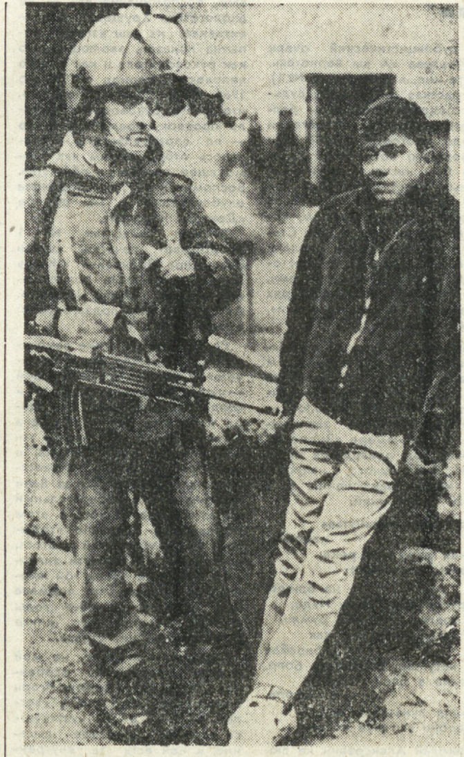
Ближний Восток. Тысячи арабов-палестинцев приняли участие в антиизраильских выступлениях в Наблусе, Рамаллах, Газе, в десятках других палестинских населенных пунктах.