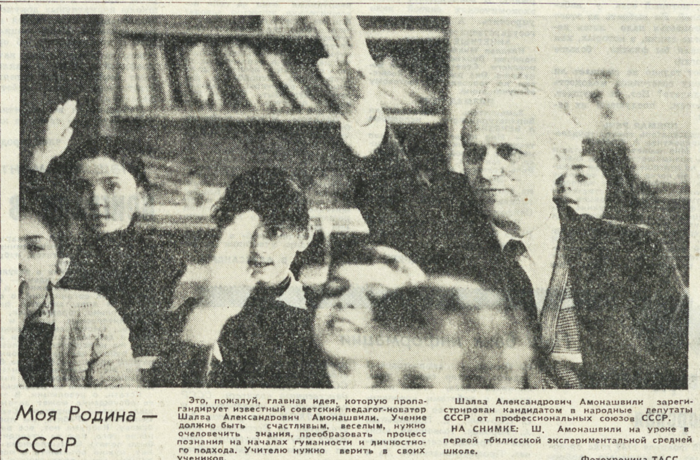
Моя Родина — СССР