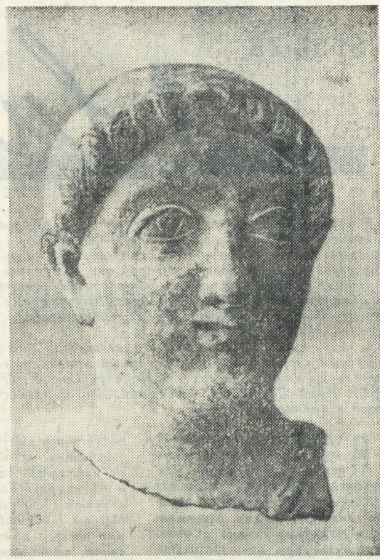
С тех пор, как в Историческом сквере несколько лет назад открылся Музей изобразительных искусств, свердловчане и гости столицы Урала получили возможность, выходя из музея, ознакомиться с сокровищами мирового искусства из собраний музеев