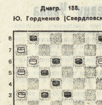
Белые выигрывают. Ответы на задания:

Диагр. 179. Б: а2, с3, е5, d2, d4, g1, h4 (7). С: а5, а7, с7, е7, f4, f6, h6 (7). У белых три отвода.