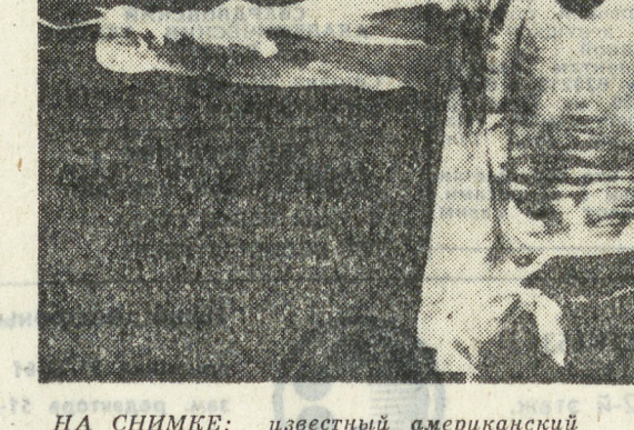
НА СНИМКЕ: известный американский рок-певец Майкл Джексон после исполнения своего хита «Человек в зеркале» в Лос-Анджелесе, штат Калифорния, завершающего последний концерт его шестнадцатилетнего мирового турне. М. Джексон посетовал

ва 100000 долларов из сборов от концерта в пользу «Чайлдхелп Ю-Эс-Эй» — американской организации, занимающейся исследованием, профилактикой и лечением детских заболеваний.