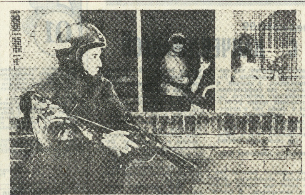
«Незаживающая рана Европы» — так часто в печати называют Олстер. Кровавые уроки Северной Ирландии хорошо известны в мире. Однако, судя по этому снимку, они за двадцать лет трагедии мало чему научили британские официальные власти, которые по-прежнему при решении проблем делают ставку на грубую силу.