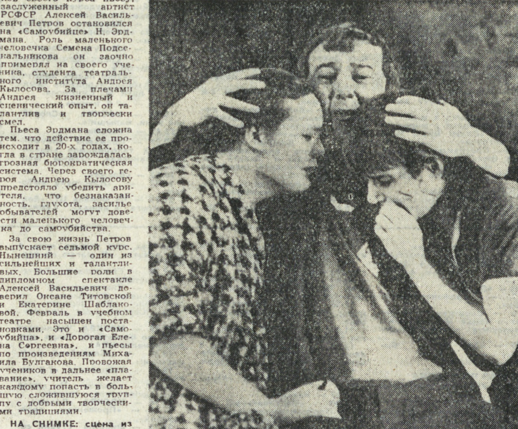
НА СНИМКЕ: сцена из дипломного спектакля «Самоубийца».