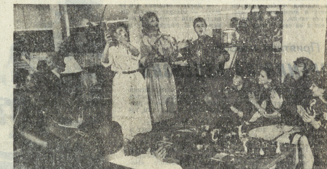
ЧТО ПРОИСХОДИТ, «КОГДА ПОЮТ СОЛДАТЫ». На этот вопрос ответил зритель, пришедший в Дом советской науки и культуры в Берлине. Фестиваль ГДР, где проводился фестиваль с таким названием. Ответили аплодисментами и улыбками, горячо приветствуя каждого участника.

СОФИЯ. Превратить кооперативные хозяйства Болгарии в самостоятельные фирмы, которые могли бы быть самоуправляющимися и самодостаточными, конкурентоспособными и прибыльными. — главная цель созданного сегодня здесь Союзом трудовых производственных коопераций.