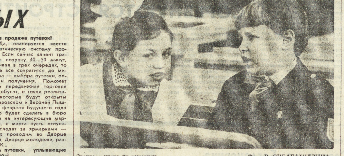
Звонка с урока не заметили.