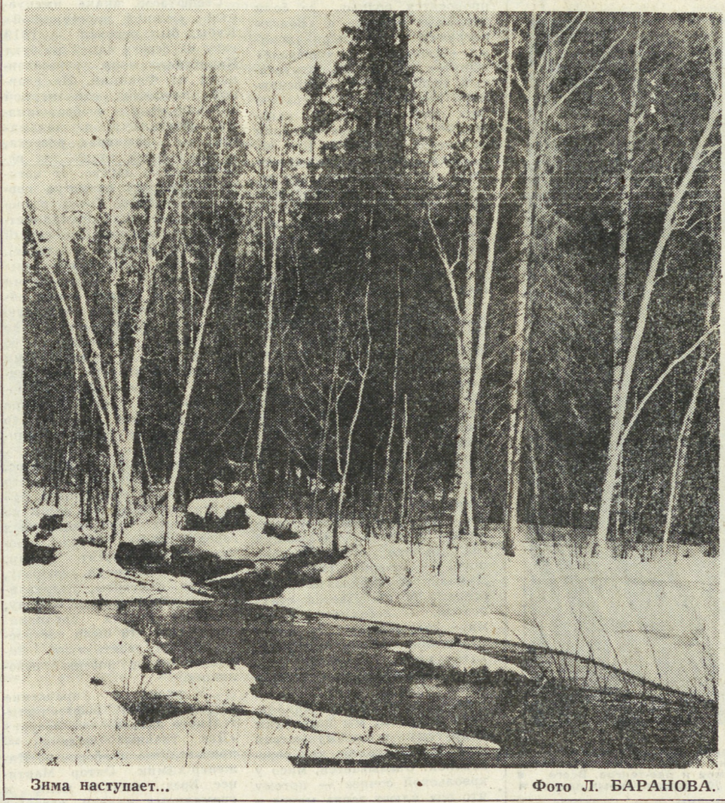
Зима наступает...