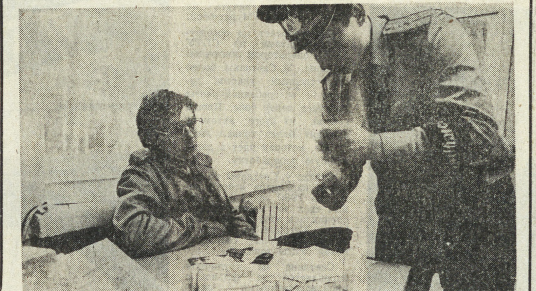
Москва. При главном управлении внутренних дел Мосгорисполкома действует специальный отдел по борьбе с правонарушениями, связанными с распространением и употреблением наркотиков.

Задача отдела состоит не только в раскрытии правонарушений, но и в их профилактике, а также в предупреждении распространения новых видов наркотиков, основанных на искусственно синтезированных химических соединениях, употребление которых часто приводит к необратимым последствиям.