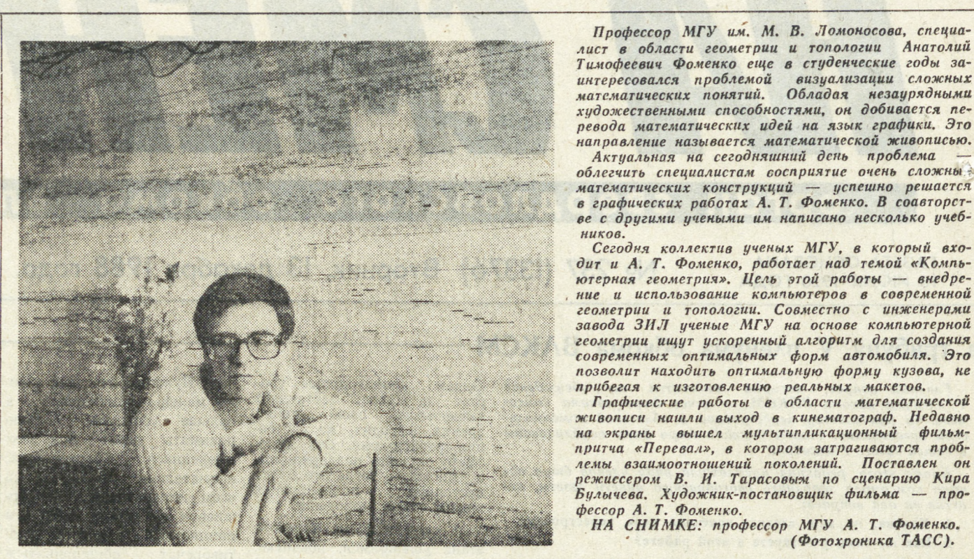
Профессор МГУ им. М. В. Ломоносова, специалист в области геометрии и топологии Анатолий Тимофеевич Фоменко еще в студенческие годы заинтересовался проблемой визуализации сложных математических понятий. Обладая незаурядными художественными способностями, он добивается перевода математических идей на язык графики. Это направление называется математической живописью.

Так, может быть, надо вспомнить эту замечательную традицию международного молодежного движения, которая зародилась в 1915 году как день боевого единения молодежи в борьбе против войны и прошла многие годы испытаний? Было бы хорошо возродить ее и начать отмечать, например, с 1 сентября 1989 года в связи с 50-летием начала второй мировой войны.