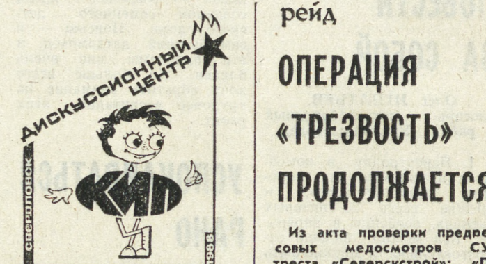
дискуссионный центр «КНИ»

— обращаться за помощью и защитой в конфликтных и трудных ситуациях к своему отряду, в районных, городских советах пионерской организации; если помощь не оказывается, ставить вопрос вышестоящих органах (областном, центральном советах); — оставаться членами пионерской организации после 15 лет (по решению своего пионерского коллектива); — выбирать районные, городские, областной совет пионерской организации, которые отвечают за судьбу нового коллектива. Пионер состоит только в одном пионерском отряде, свободно выбирает отряд и может добровольно переходить из одного в другой, для этого достаточно решения самого пионера и того отряда, в который он вступает;