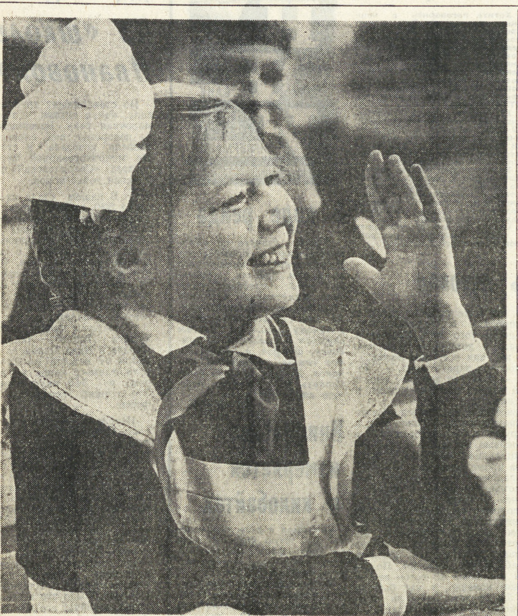
И знаю!