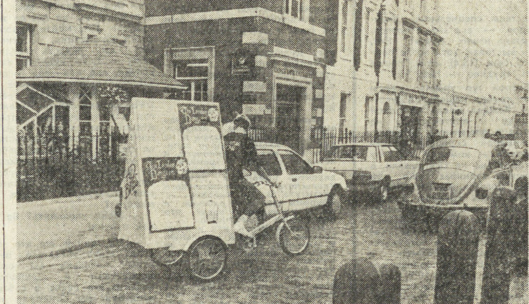
Лондон — один из старейших европейских городов, столица Великобритании, ее политической, экономической, научной и культурной столицы.