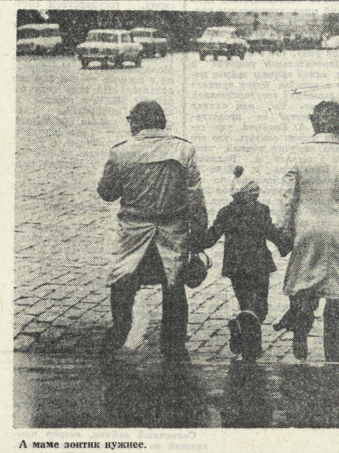
А маме зонтик нужнее.