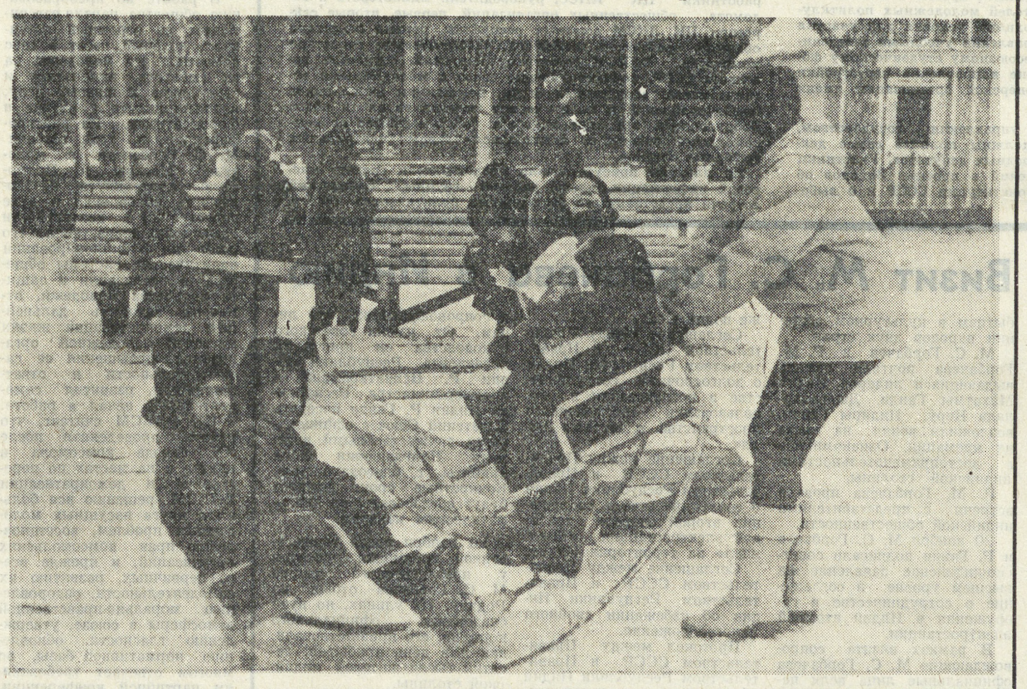
Организовать своеобразные филиалы в них для самых увлеченных мальчишек и девочек.