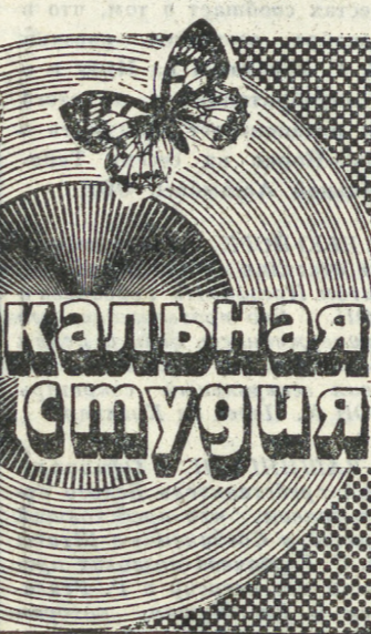
Музыкальная студия 51-60-84