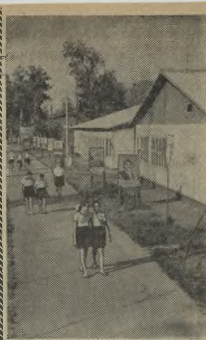
Днепропетровская область. На берегу Каховского моря разместился пионерский лагерь треста «Никопольстрой». Сейчас здесь отдыхают 300 детей строителей, а за лето около тысячи школьников проведут каникулы в этом замечательном уголке.

На снимке: пионерский лагерь треста «Никопольстрой».