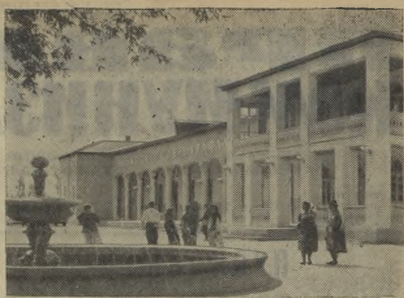
В сельхозартеле „Большевик“ Багдатского района Ферганской области построен колхозный клуб со зрительным залом на 600 мест.