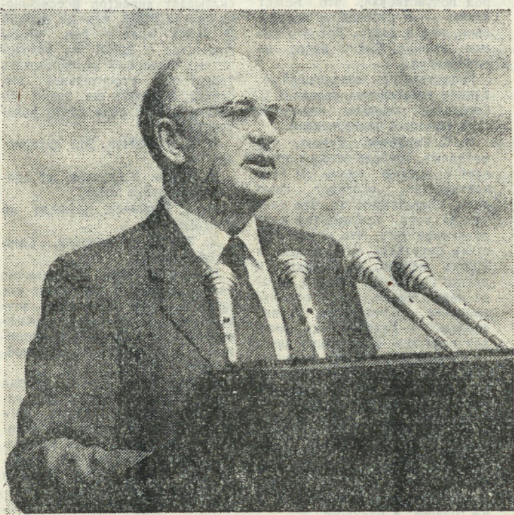
Во время встречи в Московском дворце молодежи.

По просьбе комсомольцев Михаил Сергеевич записывает в книге отзывов экспозиции: «Горько приветствую Вашу инициативу».