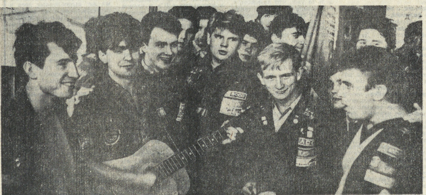
И минувшую пятницу в свердловском Дворце спорта профсоюз состоялся слет областного студенческого отряда. Он был посвящен 25-летию областного отряда, речь шла об итогах летнего трудового семестра. На снимке, сделанном во время слета, бойцы стройотряда «Карат» Свердловского горного института.