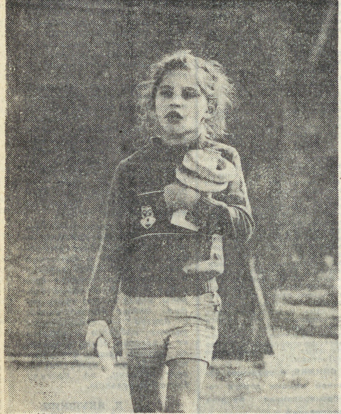
«Задание мамы выполнено». «Старшая сестра».

Очередная тема, на которую наши читатели приглашаются в 19 час. 30 мин. 21 октября, звучит, прямо скажем, несколько необычно: «Сексуальная активность человека и цвет». Что же, специалистом, как говорится, выдаете... Впрочем, не будем загадывать, есть ли здесь проблема. Вспомним только, что предыдущие встречи в этом цикле были интересны и поучительны.