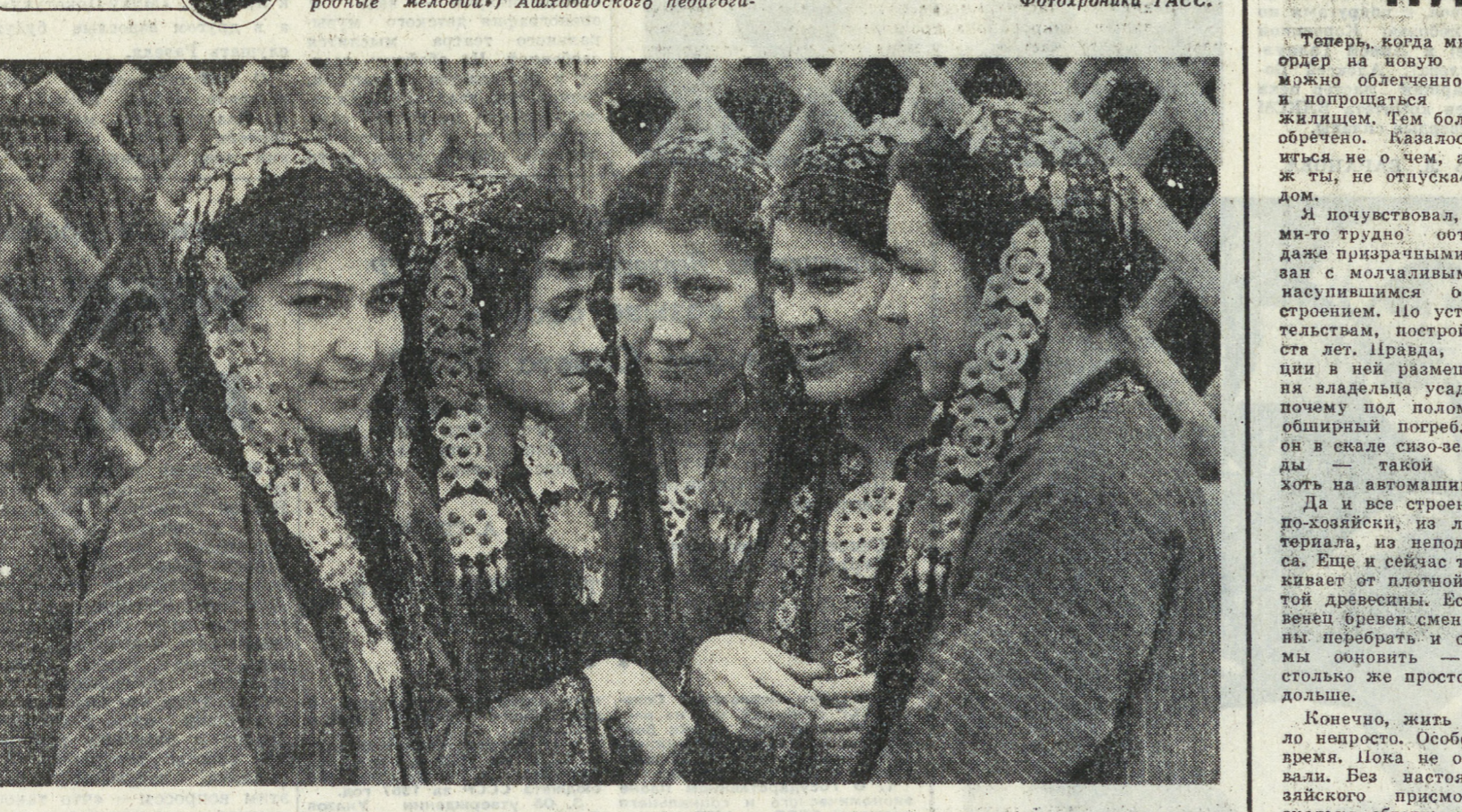
Всегда тепло встречают зрители выступления танцевального ансамбля «Мужик» («Народные мелодии») Ашхабадского педагогического института русского языка и литературы. НА СНИМКЕ: участники ансамбля.