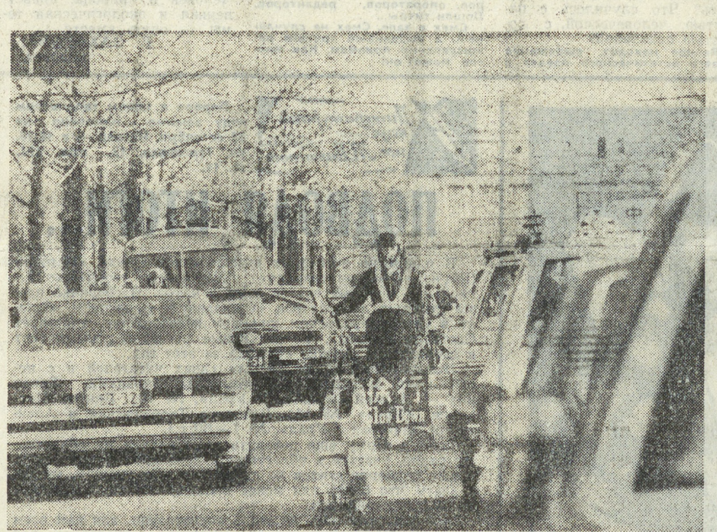
ЯПОНИЯ. НА СНИМКЕ: полицейский патруль в центре Токио.