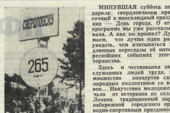
(Окончание на 3-й стр.)