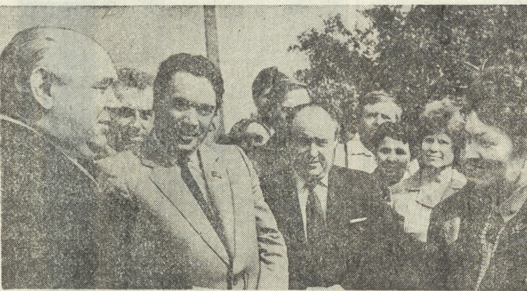
НА СНИМКЕ: секретарь ЦК КПСС В. П. Никонов встретился 4 августа с трудящимися и молодежью в совхозе «Верхнепыльминский».

Пребывание секретаря ЦК КПСС В. П. Никонова на Среднем Урале