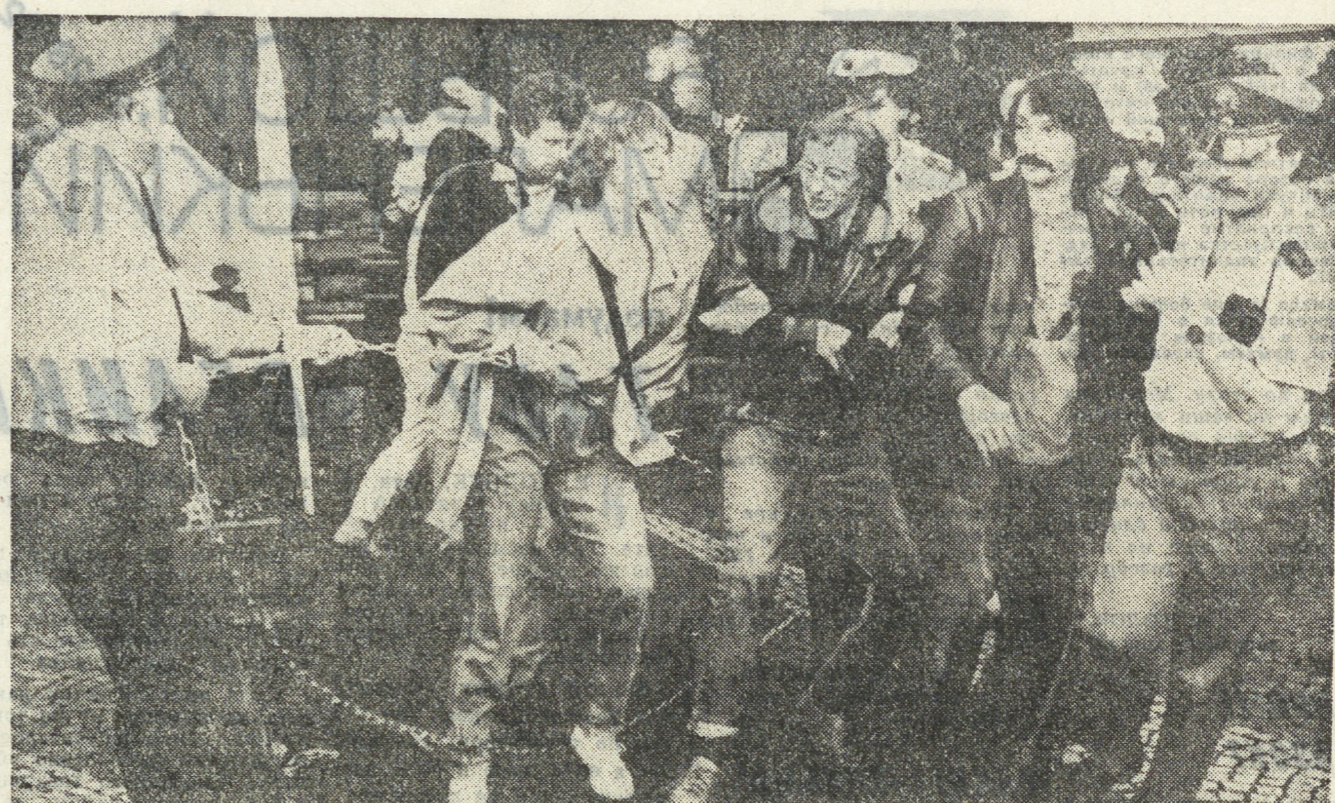
Террор, чинимый у себя в стране расистским режимом Претории, вынудил, в частности, вопиюще несправедливый приговор в отношении шестерых борцов против апартеида...

Особые успехи были отмечены американского певца Брюса Спрингстона, а также группы «Зилли» (ГДР).