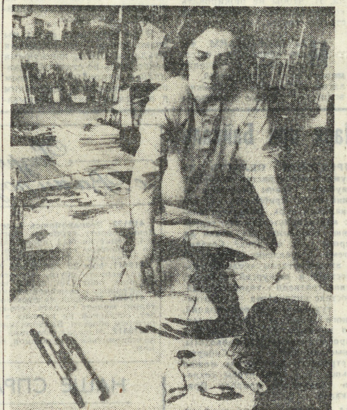
Как и во всем мире, женщины Чехословакии не отстают от моды. Следить за ней им помогает Пражский институт культуры...

Как указал в ходе слушаний конгрессмен Р. Уайден, в США ежегодно продается косметических средств и препаратов на сумму около 17 миллиардов долларов.