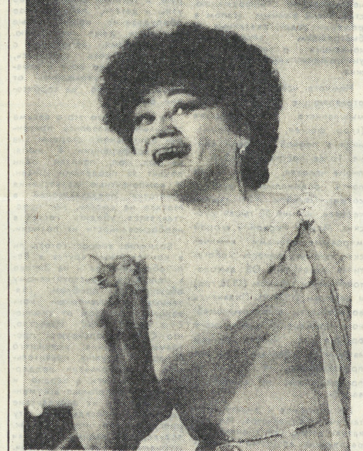
Заканчиваются гастроли в Свердловске академического театра оперы и балета Молдавской ССР. Мы познакомились не только со спектаклями гостей из Кишинева, но и с концертными выступлениями мастеров оперного искусства.