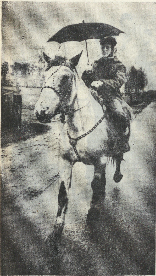
Дождик не помеха.