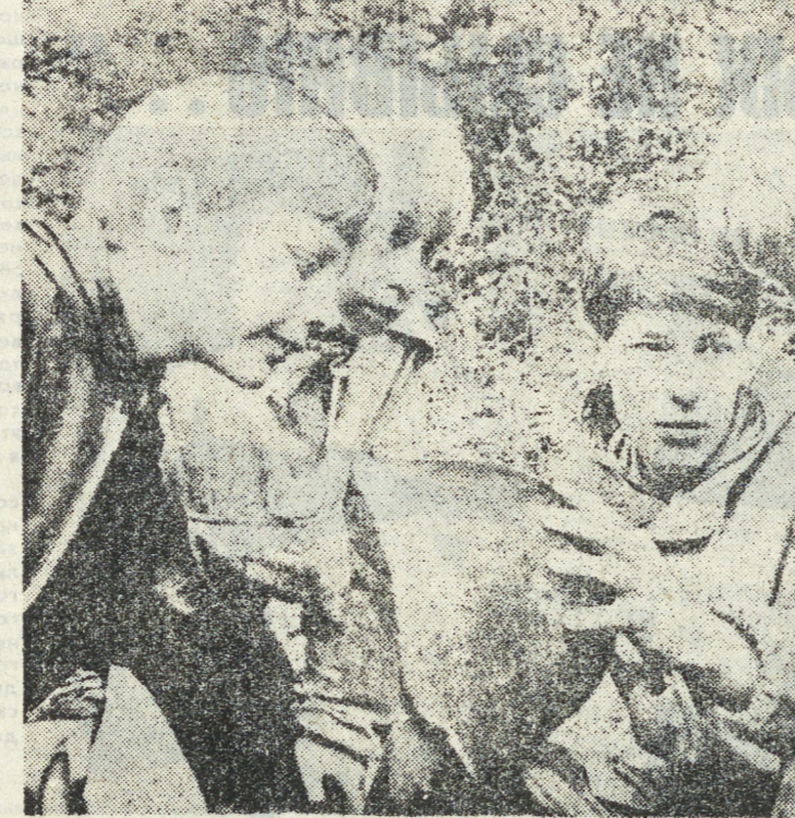
Экспедиция «Память» в Смоленском лесу.