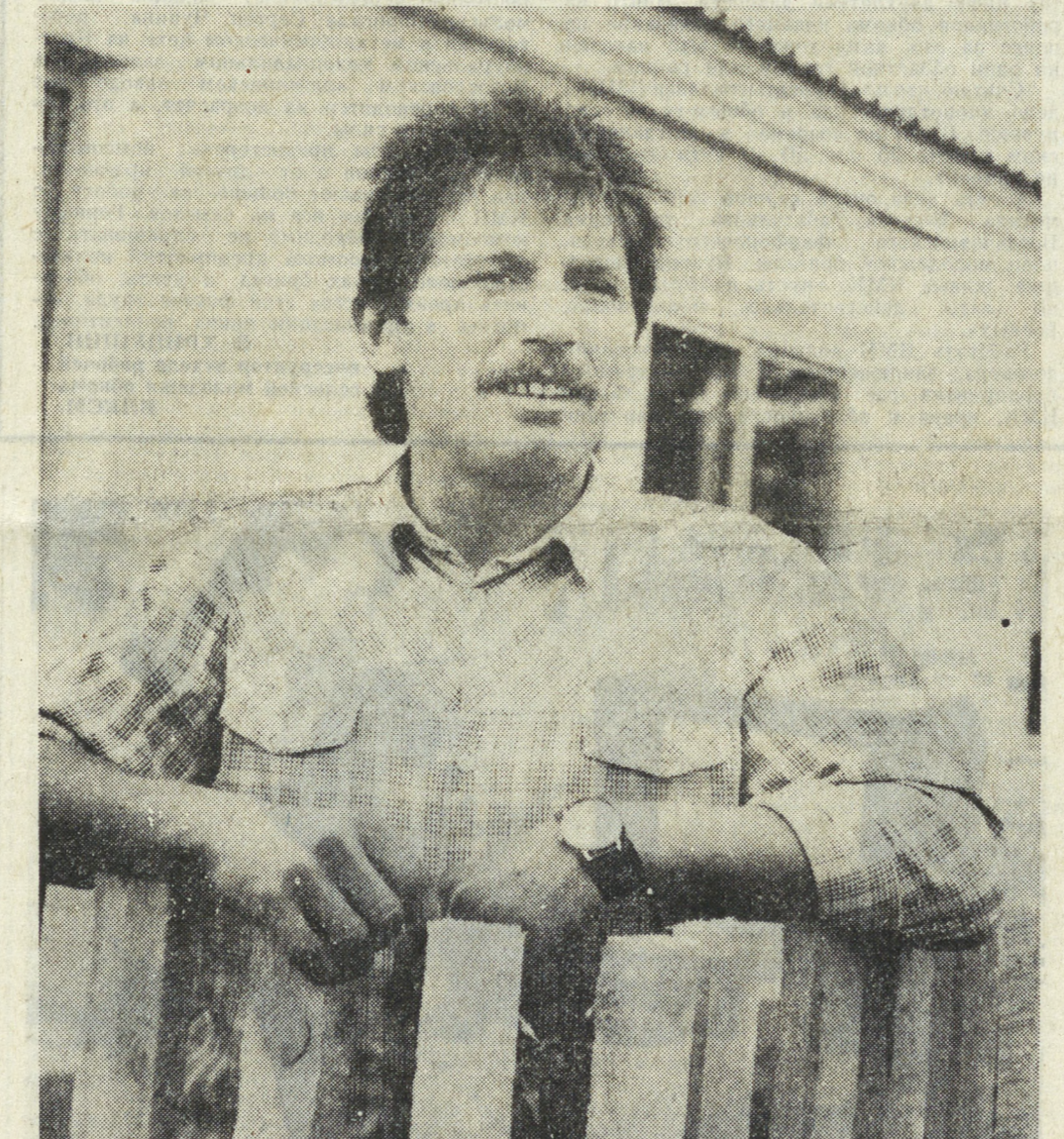
800 квадратных метров жилья сдадут в этом году строители колхоза «Красное знамя» Богдановичского района...