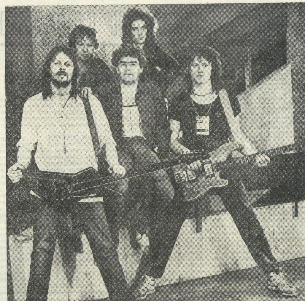
о сделанной кем-то аграрной работе... Я верю им, когда в одной из песен со сцены несется гордо: «Мы из СССР!» Куда пойдет «Флаг» дальше? Пока их неоднократно отработанный репертуар восторгом принимают зрители Казани, Набережных Челнов, Кургана и Тольятти, приходят приглашения с Дальнего Востока из Ленинграда. Но... Помоему, нельзя вечно эксплуатировать когда-то найденную тему или прием (это касается не только «Флага»). Любовое решение темы, еще недавно бывшее в «десятку», сейчас редко идет в «молоко». За последние три года пресса подняла столько острых и горьких тем, что никого не удивишь острым фактом или ситуацией. А именно это делает рок-музыку выразителем умонастроений молодежи еще не так давно. По-моему, участникам «Флага» нужно искать если и не новую тему, то — новый подход к ней. Дать картинку события, зафиксировать явление — легче, чем донести до слушателя его суть. Осмысление дается труднее деклараций. Это стало причиной «схода» многих гремешки когда-то рок-музыков. Хочу верить, что «Флаг» справится с этой задачей. М. ЗАЯКИН. НА СНИМКЕ: рок-группа «Флаг».