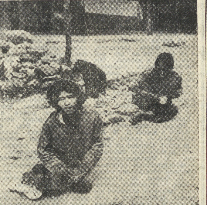
Этот снимок сделан корреспондентом ТАСС в деревне племени мео близ города Чангай на севере Таиланда. На нем запечатлен всего лишь фрагмент из жизни людей, которых в Таиланде принято относить ко «второму сорту». Поголовная нищета, отсутствие элементарных условий существования (о «блате» и «наших лопатках» здесь и речи быть не может), безработица — таков удел представителей этого немногочисленного племени.

тальные кадры убийства людей и животных. Многие малолетние убийцы признаются, что решились на преступление именно под воздействием сцен из этого фильма. В Хьюстоне (штат Техас) 10-летний мальчик хладнокровно застрелил отца и тяжело ранил мать. Школьники из Делема (штат Массачусетс) заманил в лес и избил до смерти бейсбольной битой одноклассника... Может быть, после этого ленту, проповедующую жестокость, запретили? Отнюдь. Несколько дней назад «Лица смерти», предназначенные первоначально лишь для проката в форме видеокассеты, были в самое удобное время показаны по каналу одной из телекомпаний. С. БАБИЧ, (ТАСС).