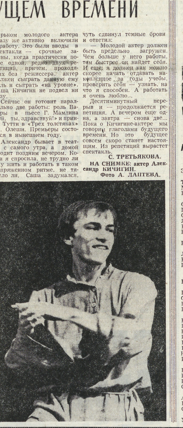
Может быть, поэтому на сентябрьских гастролях в