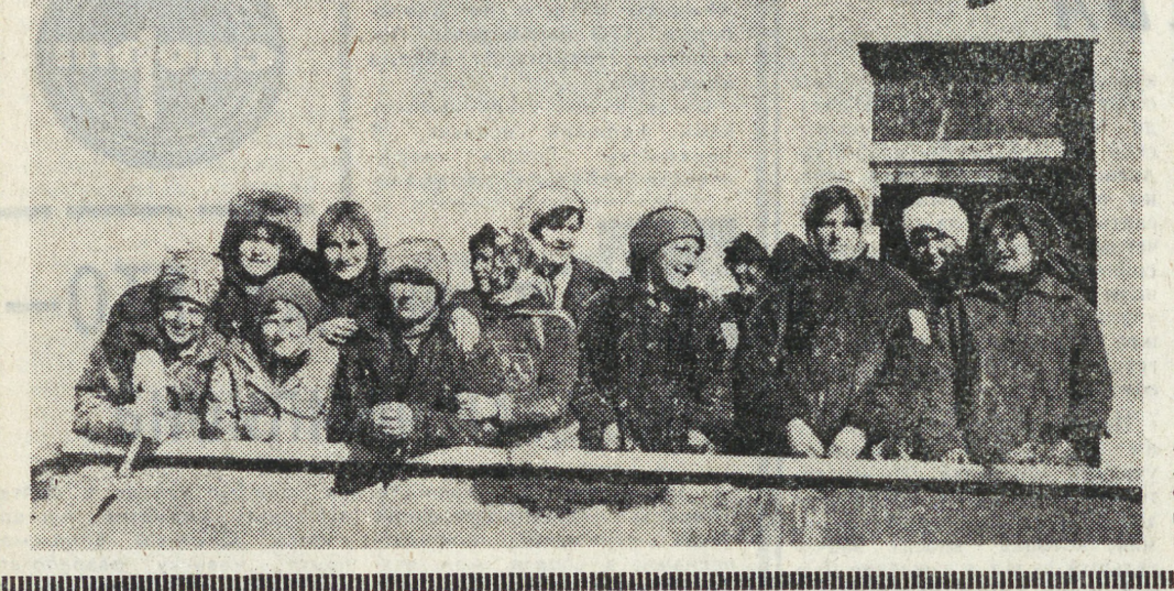
Посланный нашей областью на магистраль века строители БАМа.

Отцы нам пели: «Эх, дороги...» И мы смотрели на отцов, И вновь казалась: по тревоге Шло поколение бойцов. Сосредоточенных и хмурых, Исчуживших морщин штыков. Из Комсомольска-на-Амуре, Из Уральских степей, И грохотали самоходки, И надышились дымом: «Я бы мог, А не товарищи-погоды! Завтра вспыхнут у дороги, Отцов дороги продолжали Их возмущавшие сыны, Любая дорога продолжение — Великих строек имена. Они — нежны, Они — суровы, В них радость встреч И боль разлуки. Над ними радуга, Как новый, Под тучи вставший виадук. Ах, комсомольцы! Ты неповторима Неповторимостью дорог. Я слышал, Девушка любимой Шептала в вагоне паренек: «Всю Землю хочется На ней все выстроить потом. Мы слышим дедов: «Эх, дороги! Продолжим, А не повторим».