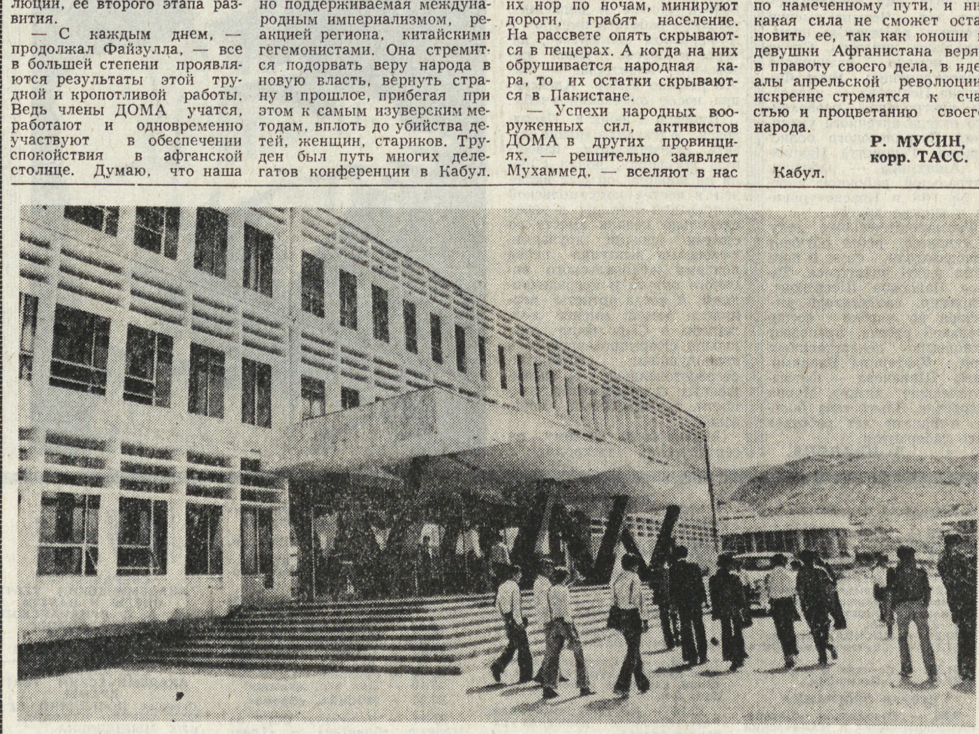
Комплекс зданий Кабульского автомеханического техникума (на снимке) резко выделяется на фоне глинобитных строений старого Кабула.