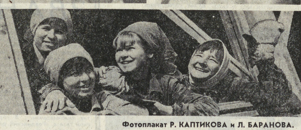
Фотоплакат Р. КАПТИКОВА и Л. БАРАНОВА.