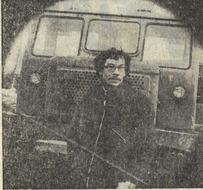
Первомайский участок в Бисертском леспрохозе в передовых числится. 35 тысяч рублей составляет его доля от миллионной прибыли всего хозяйства. И это всего за один квартал нынешнего года!

А раньше, говорят, лес по реке сплавляли, да обмелели они нынче. А лес, что вплотную к деревне подступал, вырублен. Правда, поднимается молодая поросль, посаженная теми же руками, что и топор держали. Да когда еще взметнется зеленой свежью в небеса эти подростки-сосны? Время и для этого нужно немало.