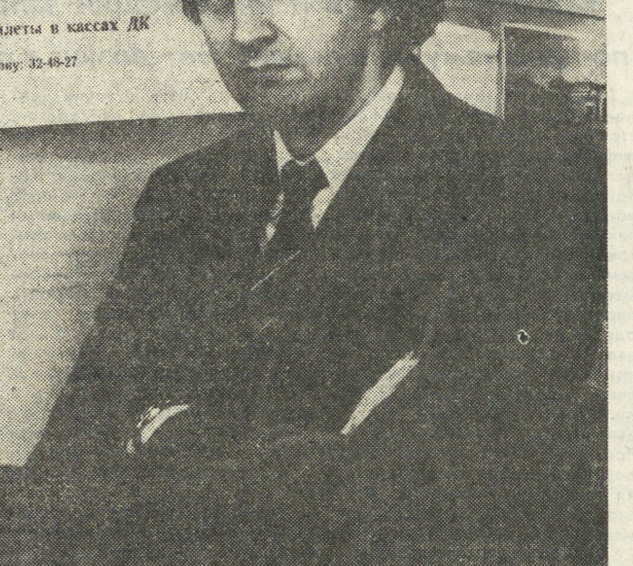
Леонид ЯРМОЛЬНИК (г. МОСКВА)

ХОТИТЕ ПОСМЕЯТЬСЯ? ПРИХОДИТЕ. 3 апреля, 4 апреля, 5 апреля, 6 апреля. Спешите приобрести билеты в кассах ДК. Срочно по телефону: 32-48-87.