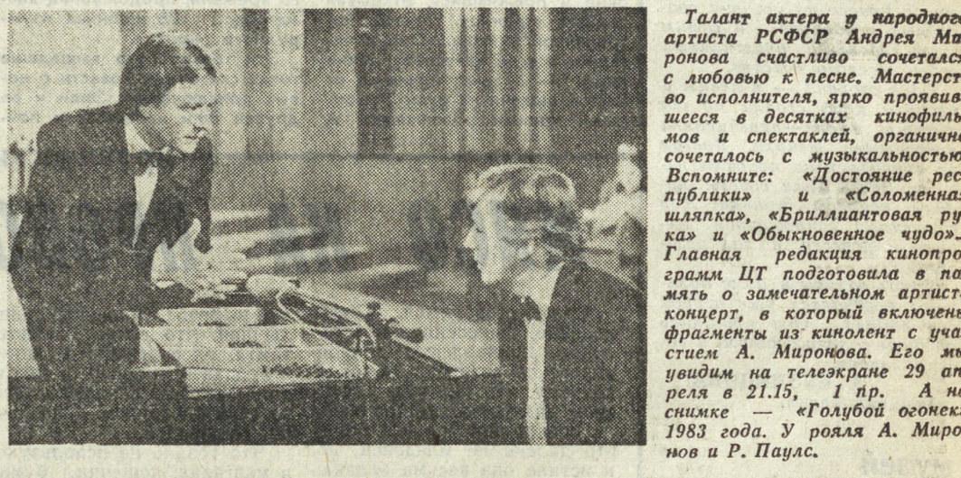
Такая атмосфера в народном артиста РСФСР Андрея Миронова создавалось сочетаясь с любовью к песне. Мастерство исполнителя, ярко проявившееся в десятках кинофильмов и спектаклей, органично сочеталось с музыкальностью. Вспомните: «Достоинство республики», «Соломенная шляпка», «Бриллиантовая рука» и «Обыкновенное чудо»... Главная редакция кинопрограмм ЦТ подготовила в память о замечательном артисте концерт, в который включены фрагменты из кинолент с участием А. Миронова. Его мы увидим на телеэкране 29 апреля в 21.15. I пр. А на сцене — «Голубой огонек» 1983 года. У руля А. Миронов и Р. Паулс.