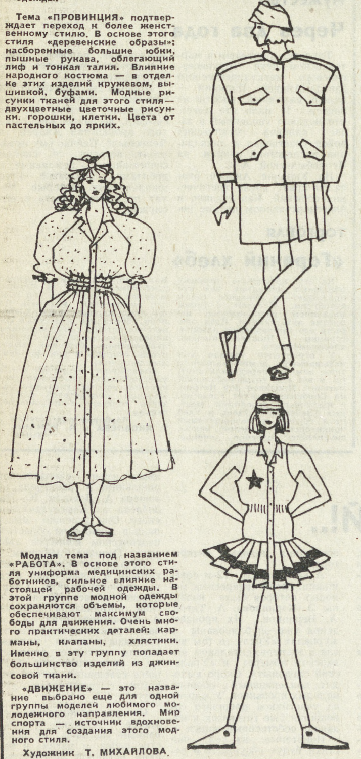
Художник Т. МИХАЙЛОВА.