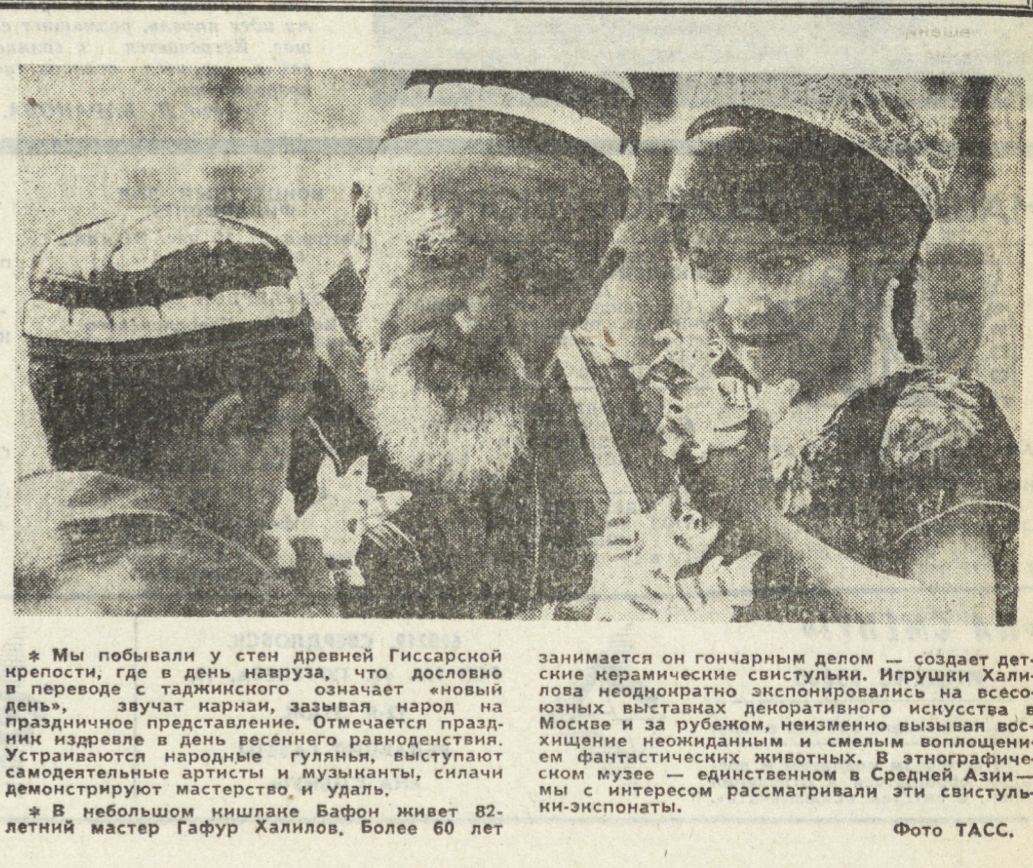
Мы побывали у стен древней Гиссарской крепости, где в день нагуазу, что дословно означает «новый день», звучат наряду с музыкой народ на праздничное представление. Отмечается праздничное издревле в день весеннего равноденствия. Устраиваются народные гуляния, выступают самодеятельные артисты и музыканты, синичи демонстрируют мастерство и удачу.

бразильскому пляжу Ипанема, где в день нагуазу, что дословно означает «день без табака», звучат наряду с музыкой народ на праздничное представление. Отмечается праздничное издревле в день весеннего равноденствия. Устраиваются народные гуляния, выступают самодеятельные артисты и музыканты, синичи демонстрируют мастерство и удачу.