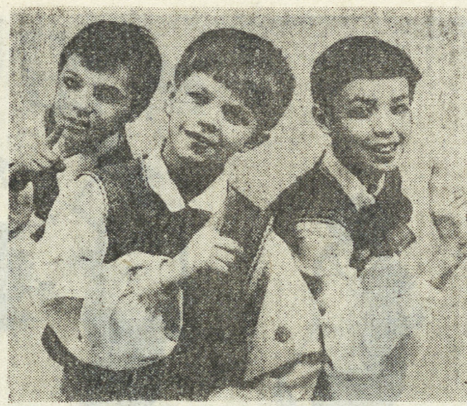
В классическом балете творческая биография у исполнителей по многим причинам начинается в раннем возрасте.

Гости получили на память красочные книги о знаменитом уральском малахите, вручили оргинмету сувениры от своих делегаций.