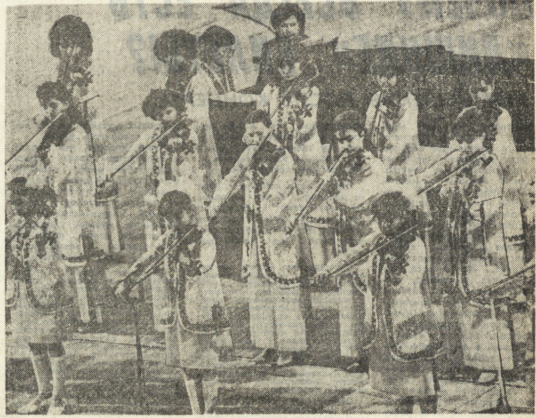
В ансамбле играют ученики республиканской средней специальной музыкальной школы — от 5-го класса до выпускного.

В ансамбле играют ученики республиканской средней специальной музыкальной школы — от 5-го класса до выпускного. Проблема выбора будущей профессии перед нашими ребятами уже не стоит, они на всю жизнь выбрали музыку.