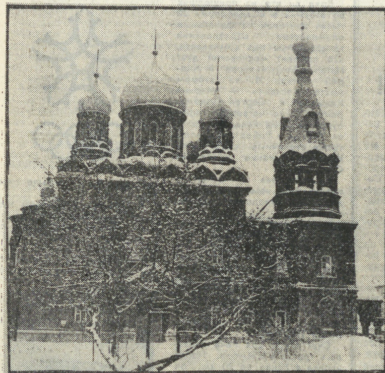
Архитектурный памятник — собор Александра Невского, а ныне Красноуфимский этнографический музей. Никак не обойдет его взгляд приезжего человека. Если хотите поближе узнать о славных традициях города, чем богата история этого края — приходите в музей.