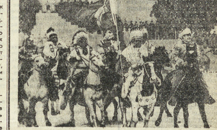
НА СНИМКАХ: общий вид стадиона; во время церемонии открытия Белой Олимпиады.