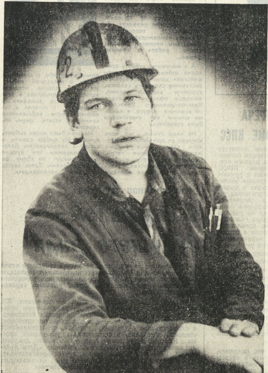
производственный мастер участка магнитного обогащения аглоцеха-2 Высокогорского рудопроцессора, руководитель КМК.

Считаю, что КМК должны быть на голову выше других коллективов, иначе зачем огородить. Когда в цехе создавали комсомольско-молодежный коллектив, много разговоров шло вокруг того, каким быть новому КМК. Нас предупреждали, что не стоит крепкой бригаде делиться на членов и нечленов КМК, можно и прогадать.