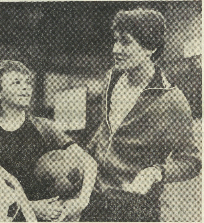
Таких образом, борьбу за медали первенства продолжат ЦСКА, «Динамо» (М. о.), «Авангард» (Ленинград), СКА (Минск), «Дорожник» (Алма-Ата) и «Локомотив» (Ижевск).

В Свердловске и Первоуральске завершились игры первого круга мужского чемпионата СССР. В последний игровой день свердловского тура сурри-преподнесли динамовцы Ташкента, победившие в труднейшем трехчасовом поединке рижский «Радиевтехник» со счетом 3:2.