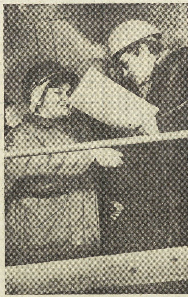
НА СНИМКАХ: участники митинга; во время вручения передовикам наград ЦК ВЛКСМ.

Сбойка. Она входит в судьбу проходчика, как покорная альпинистом вершина. Или завершение круго-