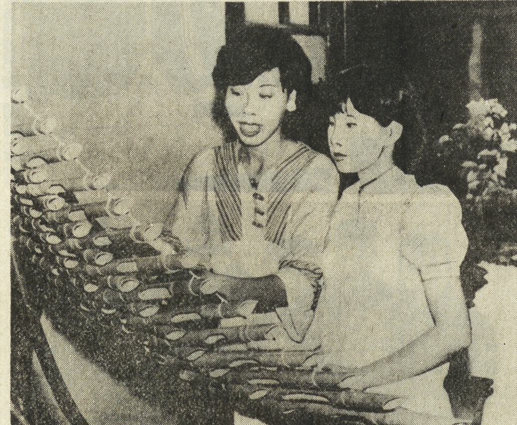
Бережно хранят и приумножают во Вьетнаме культурные традиции всех народов. НА СНИМКЕ: на уроках музыки в школе.

Большую заботу проявляют румынские архитекторы о сохранении памятников старины, неповторимого облика города.