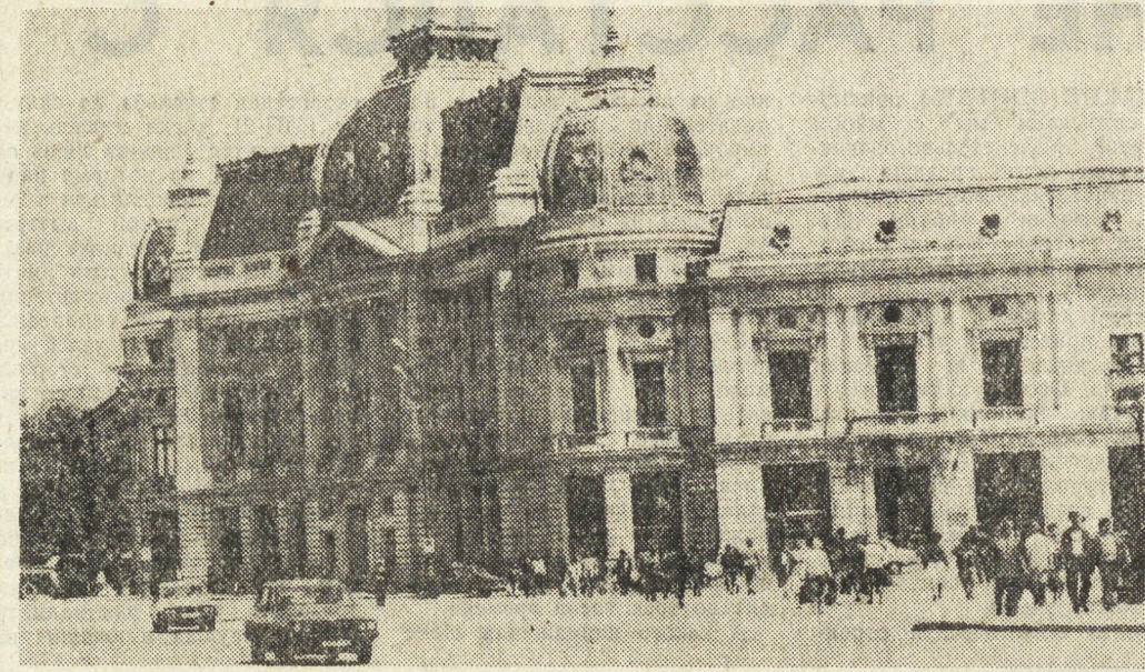
30 ДЕКАБРЯ — 40-ЛЕТИЕ СО ДНЯ ПРОвозглашения РУМЫНИИ НАРОДНОЙ РЕСПУБЛИКОЙ (1947). С 1965 г. — СОЦИАЛИСТИЧЕСКАЯ РЕСПУБЛИКА РУМЫНИИ.

Бухарест — столица социалистической Румынии. Только за четыре последние пятилетки город удвоил за счет новостроек свой жилой фонд.