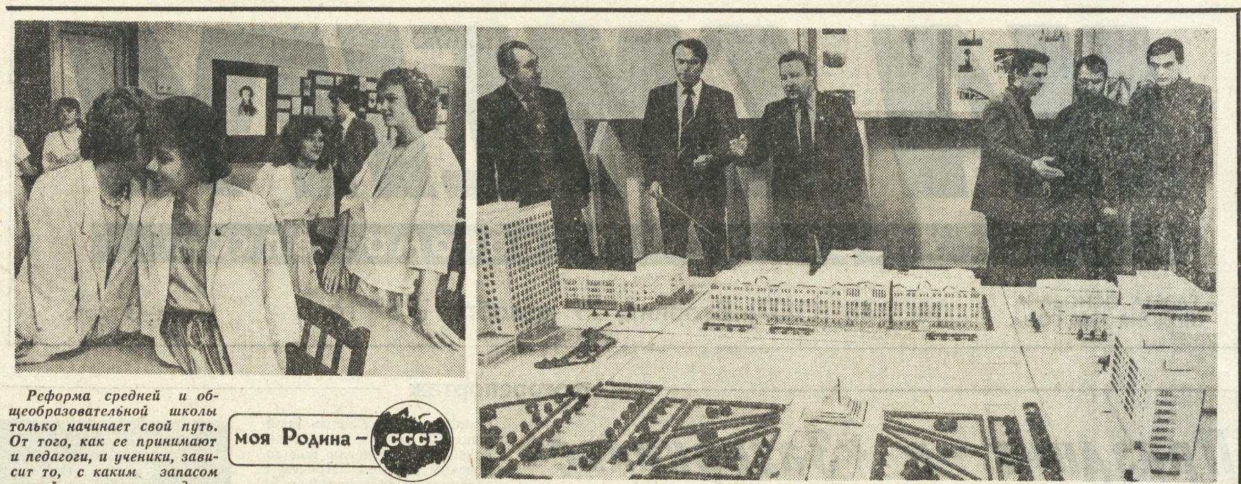
Реформа средней и общеобразовательной школы только начинает свой путь. От того, как ее принимают и педагогов, и учеников, зависит то, с каким запасом знаний и умением трудиться войдут в новую свою жизнь наши мальчишки и девочки...